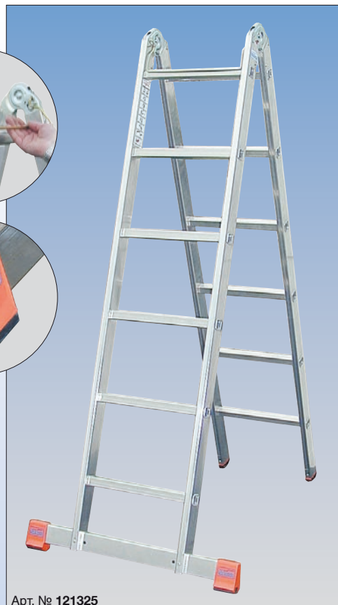
Арт. № 121325